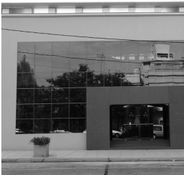
Centro Médico Trinidad Quilmes Oeste Carlos Pellegrini 525 - Quilmes - Pcia. de Buenos Aires Tel.: 0810-777-2583