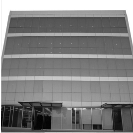
Torre III Islas Malvinas 466 - Quilmes - Pcia. de Buenos Aires Tel.: 0810-777-2583