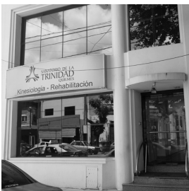
Centro de Kinesiología y Rehabilitación Carlos Pellegrini 609 - Quilmes - Pcia. de Buenos Aires Tel: 4365-0568-fax 4365-0604