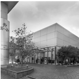
Centro de Emergencias Quilmes Carlos Pellegrini 555 - Quilmes - Pcia. de Buenos Aires Tel.: 4365-0595/0549/0650/0515